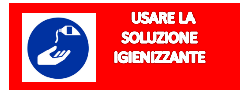
SCHEMA DISPOSIZIONE PROTOCOLLO DI SICUREZZA ANTI-CONTAGIO COVID-19